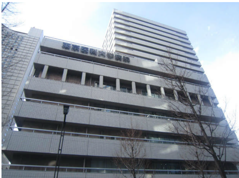
東京醫科大學醫院外觀

在參訪位於西新宿的東京醫科大學醫院 (Tokyo Medical University Hospital, TMUH) 後，兩校代表始就日後合作細節進行討論，並達成師生交換及校、院層級合約之共識，雙方皆樂見未來的實質交流合作，並希望於2012年上半年完成合約簽署，2013年開始每年定期交換師生，希望透過此合作關係，共同為醫學教育及臨床醫學品質而努力。